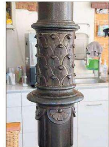
Diese gusseiserne Säule zierte Jahrzehnte lang den Beckumer Bahnhof – nun verschönert sie die Küche der Schoenefeldts.