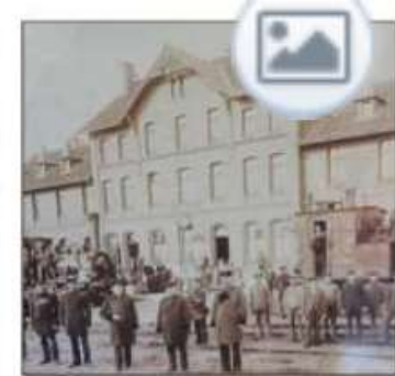
Das Foto zeigt den Beckumer Bahnhof um 1900.

„In den Lagerhallen findet die Kultur statt“, sagt Sabrina Schoenefeldt. Gemütlich hergerichtet, mit Theke, Notenständer und Sofaecke, bietet der Raum viele Möglichkeiten für Musiker und Künstler.