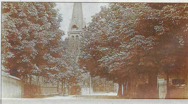
Der baumbestandene Nordwall mit der evangelischen Kirche um die vorletzte Jahrhundertwende.